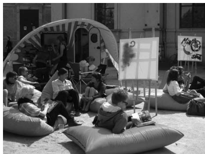
Hlavná knižnica Aarhus – karavan, knižnica na kolesách pre mládež.