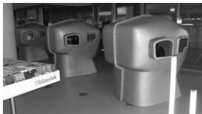
Študijné bunky v Openbare Bibliotheek in Amsterdam