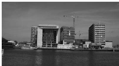
Openbare Bibliotheek in Amsterdam