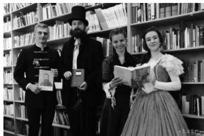
Obrázok 2 Študenti v dobových kostýmoch (Ľudovít Štúr, Jozef Miloslav Hurban, Adela Ostrolúcka a Anička Jurkovičová).