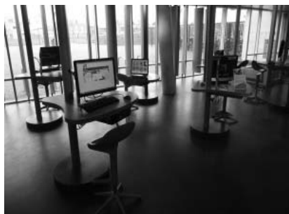
Pracovné stanice na rýchle použitie umiestnené pri vchode knižnice – Bibliotheek Floriande.