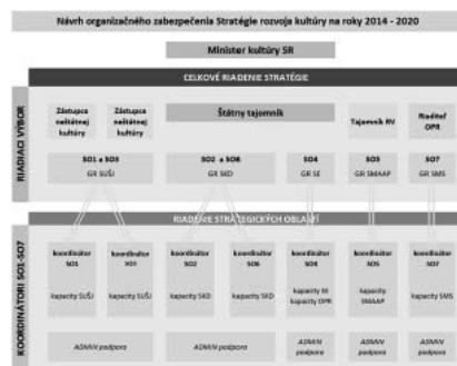
Obrázok1 Akčný plán na roky 2015-2017.

Celkové riadenie stratégie vyjadruje táto schéma: