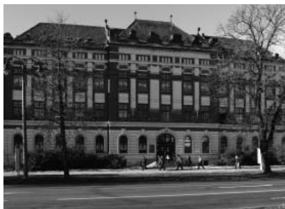
Obrázok 1 Nová budova Evanjelického gymnázia v Prešove.