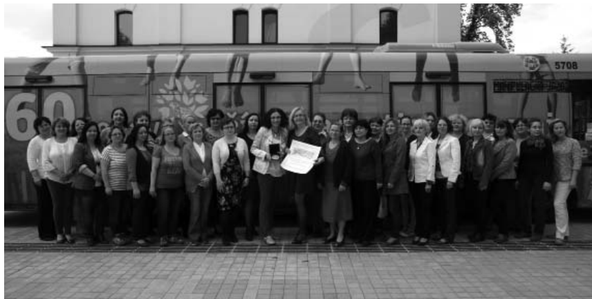
Kolektív pracovníkov Knižnice pre mládež mesta Košice s ocenením Cena mesta Košice