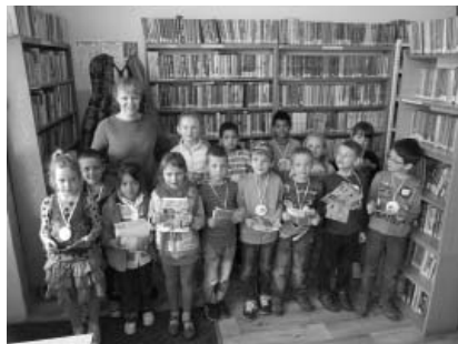
Pasovanie prvákov za čitateľov knižnice

Po polroku pôsobenia knižnice v nových priestoroch môžeme len skonštatovať, že to bol veľmi dobrý nápad. To, že sa škola nachádza v strede dediny, knižnici veľmi pomohlo. Odkedy sme v areáli školy, tak