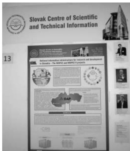
Poster prezentovaný CVTI SR

Súčasťou tohoročnej účasti na konferencii