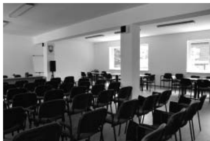
Spoločenská miestnosť v novej budove

ruch vládol v apríli. Okrem pracovníkov firmy LEMONT sa tu nastahovali zamestnanci iných dodávateľských firiem. 30. apríla boli práce ukončené.