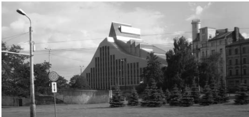
Národná knižnica Lotyšska, miesto konania konferencie

Konferencie sa zúčastnilo okolo 400 delegátov z celého sveta. Okrem desiatok prednášok významných predstaviteľov európskych vedeckých knižníc ( http://libereurope.eu/news/liber-2014-conference-programme-now-available/ ) je konferencia známa aj tým, že tu prebieha viacero rokovaní jednotlivých výkonných výborov k aktuálnym témam, ktoré v súčasnosti rezonujú vo sfére uchovávaní a sprístupňovaní informácií. Jednotlivé semináre sú zamerané na témy, ktoré sú