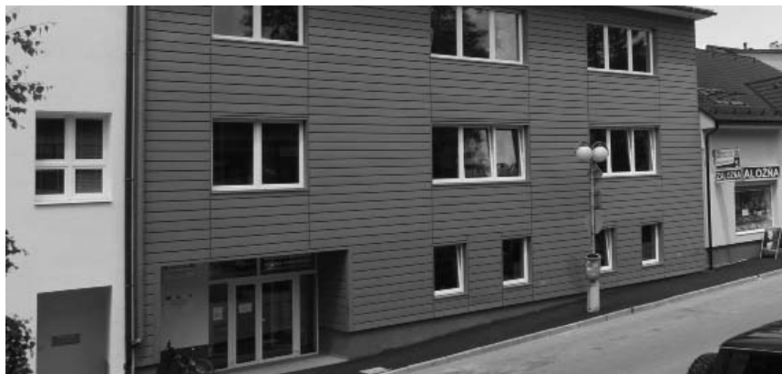
Nová budova Oravskej knižnice A. Habovštiaka v Dolnom Kubíne